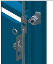
4 Serrer l'écrou