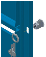
2 Mettre la serrure en place