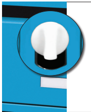
1 Retirer la vis plastique et la tringle